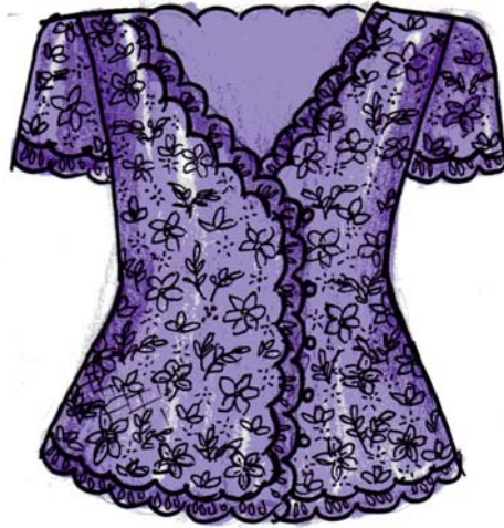
แบบที่ ๔ เลื้อกลูไม้ แขนสามส่วน คอแหลม กระดุมหน้า